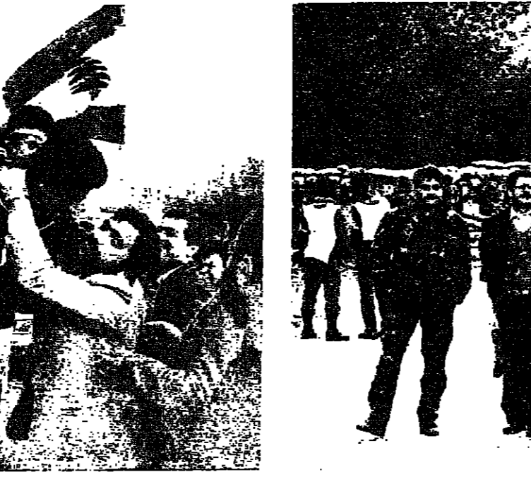
لقاء الامم والابناء